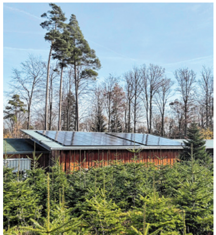
PV-Anlage am Forstthof