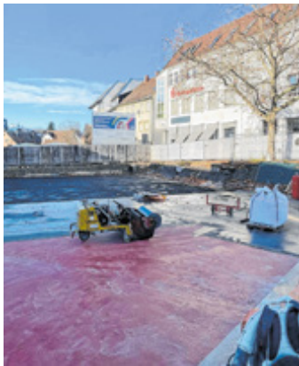
Bauarbeiten für die Tiefgarage Marktplatz

Die Bauarbeiten an der Einmündung Rathausplatz/Böblinger Straße verzögern sich. Voraussichtlich werden die Arbeiten nun bis Mitte Dezember abgeschlossen. Anschließend wird der Einmündungsbereich wieder für den Verkehr freigegeben. Die Bauzäune auf den Fußwegen werden bereits Anfang Dezember weitgehend zurückgebaut.