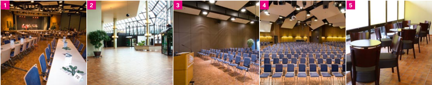
1 Der Große und der Kleine Saal mit Bankettbestuhlung 2 Das Foyer mit viel Platz für individuelle Präsentationen 3 Der Kleine Saal für Veranstaltungen bis 100 Personen 4 Der Große Saal mit Reihenbestuhlung bis 570 Personen 5 Die Bar zum gemütlichen Zusammensitzen vor der Veranstaltung oder in den Pausen